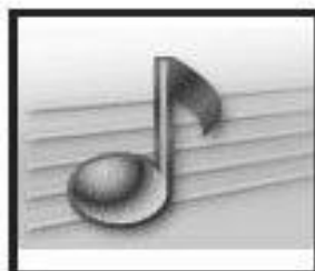
Planeta DJ 2006 (CD2-2) - 09. Up & Down-.-Mp3xNano