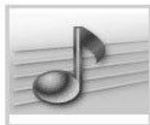
Planeta DJ 2006 (CD2-2) - 09. Up & Down - Mp3xNano