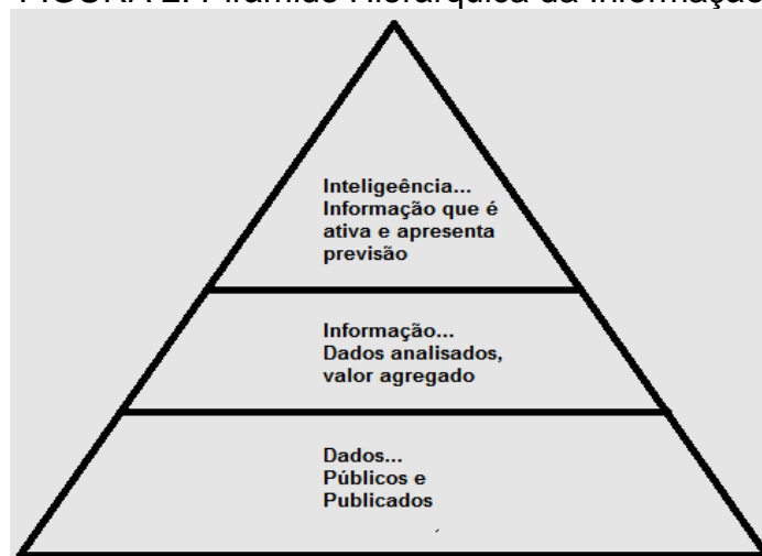
FIGURA 2: Pirâmide Hierárquica da Informação.

Fonte: Pirâmide Hierárquica da Informação de Shaker, Gembicki 1999 apud GOMES; BRAGA.