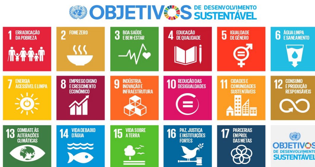
Figura 01. Objetivos de Desenvolvimento Sustentável (ODS)

É obrigatório a inclusão do plano de curso do componente curricular associado à ação de extensão junto com a submissão da proposta, SIGAA ( www.sigaa.ufrn.br ), no menu “7. Anexar arquivos”.